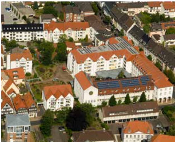
Obwohl im Herzen der Stadt gelegen bietet der Westphalenhof große Grün- und Außenflächen

Westphalenhof | Giersstraße 1 | 33098 Paderborn