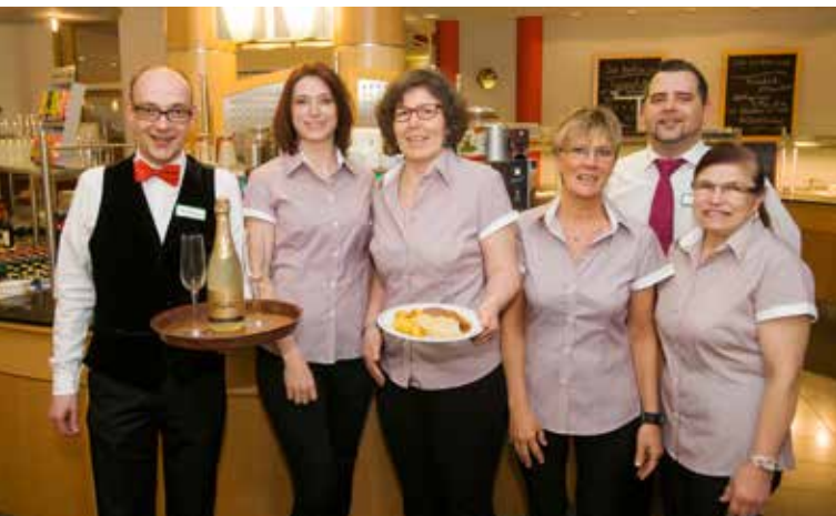
Das Team für den freundlichen Service.

Unsere Säle bieten sich an für Veranstaltungen bis zu 100 Personen. Seien es Familienfeiern oder Tagungen. Gern stellen wir das entsprechende Ambiente zur Verfügung und sorgen mit unserem Küchen- und Serviceteam für das jeweils passende Catering.